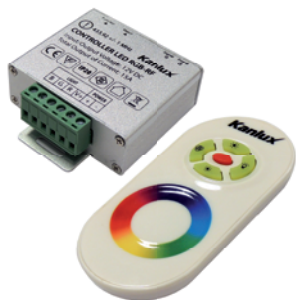
CONTROLLER LED RGB-RF