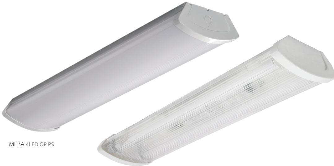
MEBA 4LED OP PS